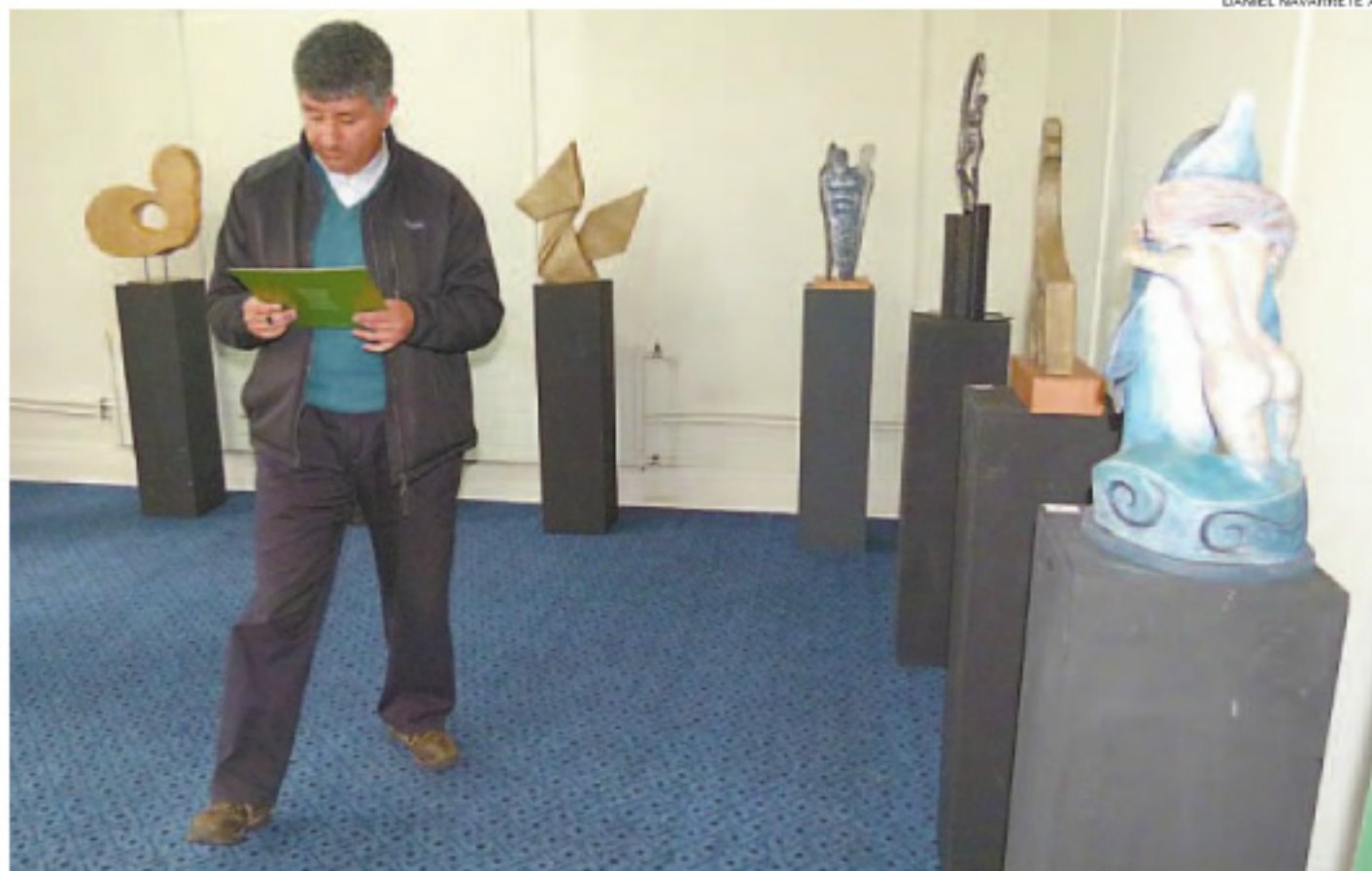
LUEGO DE LA CEREMONIA DE PREMIACIÓN DE FIN DE MES SE ESPERA QUE LAS ESCULTURAS PREMIADAS ITINEREN POR LA UNIVERSIDAD AUSTRAL.

"Estamos muy contentos con la participación que tuvimos en este concurso, ya que la idea de promover la escultura entre los funcionarios, académicos y estudiantes de todas las carreras de la Uach crece en cada nueva versión. También dimos la posibilidad de participar a la comunidad regional, lo que le da una mayor proyección a este evento", señaló Ar-