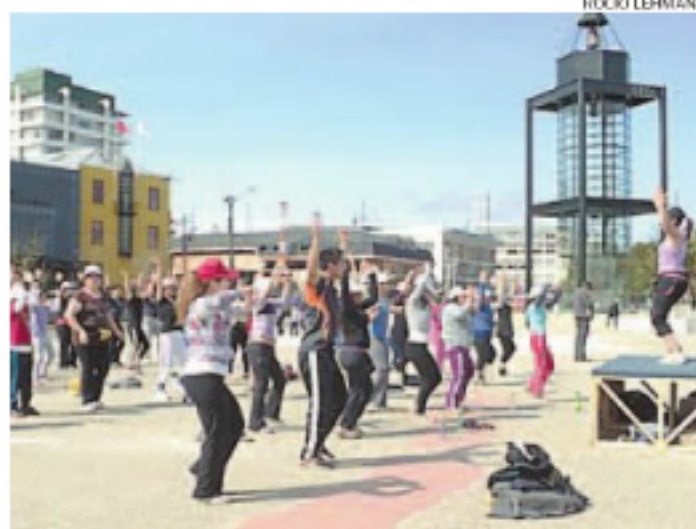
TODOS LOS RITMOS BAILABLES SE TOMARON LA COSTANERA CIENTÍFICA.

BAILE ENTRETENIDO. Maratón de zumba se tomó la costanera en la mañana sabatina.